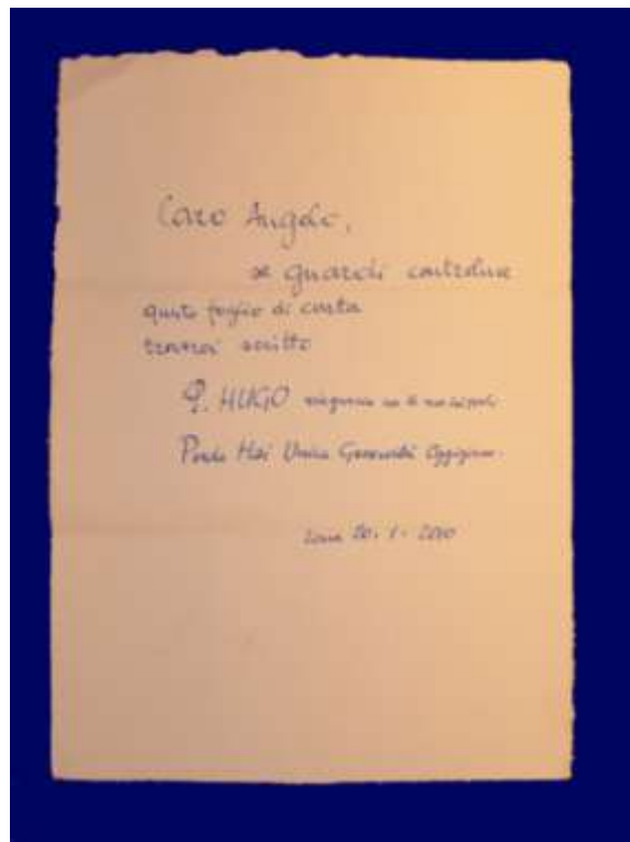
Un foglio della Papelera Don Bosco, con uno scritto di Padre Hugo

Ed ecco lo stesso foglio, visto in controluce: