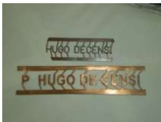
Un marchio per filigrana

Come si ottiene la filigrana? Il trucco consiste nel rendere il foglio più sottile, dunque più trasparente, nei punti voluti; ciò si può realizzare fissando sulla rete del telaio opportuni spessori, sagomati in modo da riprodurre i profili desiderati, come si vede nella figura seguente.